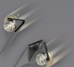
Art.-Nr.: 21436 20 MM SPITZEN