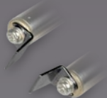
Art.-Nr.: 21434 10 MM SPITZEN