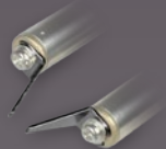
Art.-Nr.: 21431 2 MM SPITZEN