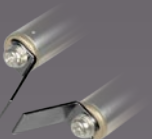
Art.-Nr.: 21433 8 MM SPITZEN