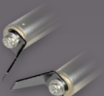
Art.-Nr.: 21432 5 MM SPITZEN